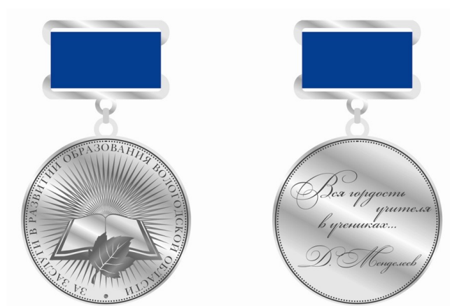
Рисунок Почетного знака Губернатора области «За заслуги в развитии образования Вологодской области»

Знак при помощи ушка и кольца соединяется с прямоугольной колодкой темно-синего цвета размером 22x14 мм. Колодка повторяет цветовую гамму знака. Колодка имеет булавочную заклепку для крепления знака к одежде.