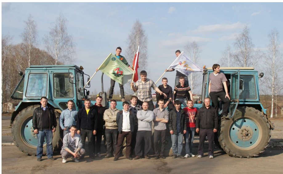
Конкурс профессий на Инженерном факультете