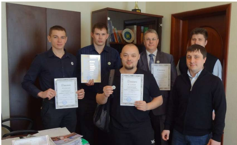
III Ежегодная научно-практическая конференция на Инженерном факультете

Конец марта и почти весь апрель в академии проходили разнообразные мероприятия в рамках Дней студенческой науки. Чтобы просто перечислить все события, нужно занять половину газеты, а потому – о некоторых из них на страницах «Академгородка».