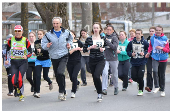
Текст, фото: Ирина Михайлова