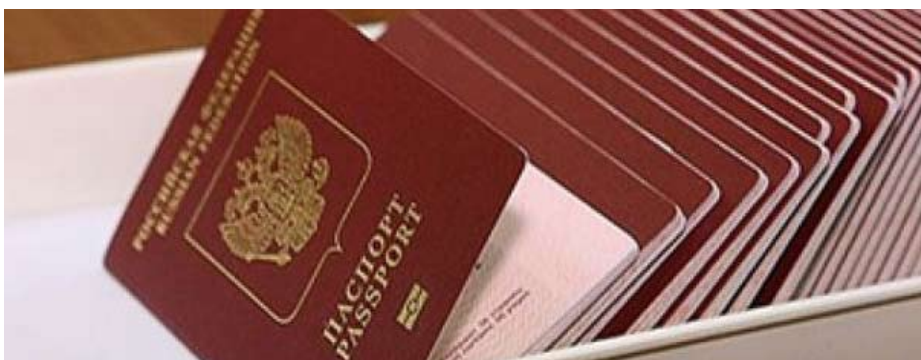
Фото при подаче заявления не требуется. Получить паспорта можно будет после

Нового года в Молочном или в Управлении миграционной службы Вологодской области.