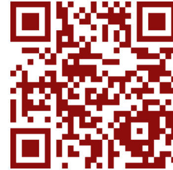
Официальная группа ВКонтакте Вологодская ГМХА им. Н.В. Верещагина