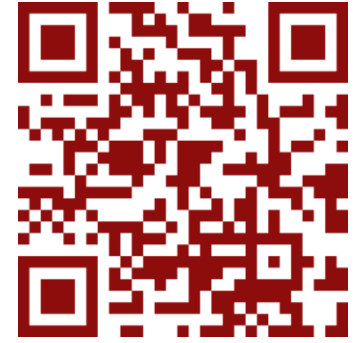
Наш телеграмм канал