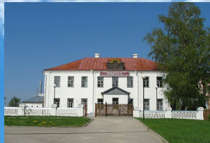
Спас-Клепиковская церковно-учительская школа