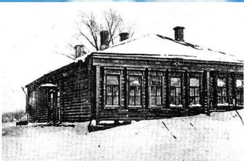
Константиновское земское четырехгодичное училище. Фото. Начало XX в.

Пяти лет Сергей научился читать. В 1904 поступил в Константиновское земское четырехгодичное училище. В мае 1909 г. окончил его с похвальным листом. Осенью 1909 г. родители отправили его учиться Спас-Клепиковскую церковно-учительскую школу. В 1912 году получил звание «учителя школы грамоты».