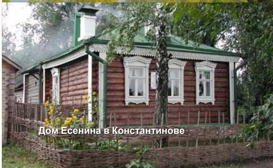
Дом Есенина в Константинове