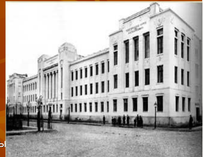
Московский городской народный университет им. А. Шанявского

В 1913 – действительный член Суриковского литературно-музыкального кружка. Секретарь редакции журнала «суриковцев» «Друг народа». В 1915 г. из-за разногласий с руководителем кружка покинул Суриковский кружок.