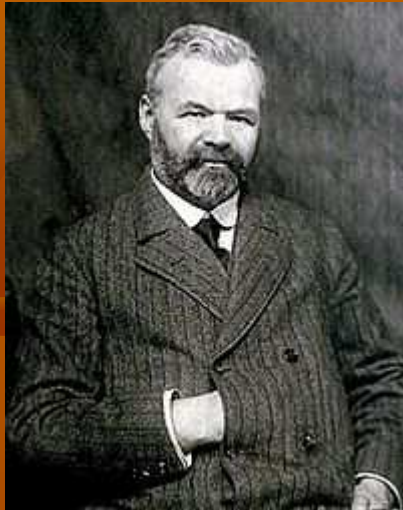
И. Д. Сытин, издатель-магнат