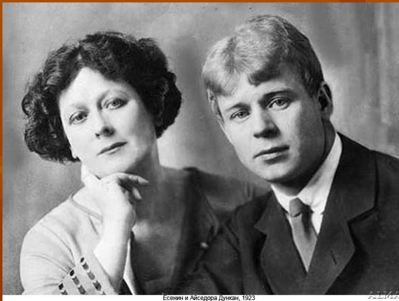
Есенин и Айседора Дункан, 1923

Событием в жизни Есенина явилась встреча с американской танцовщицей Айседорой Дункан (осень 1921 г.), которая через полгода стала его женой. Совместное путешествие по Европе (Германия, Бельгия, Франция, Италия) и Америке (май 1922 - август 1923), сопровождавшееся шумными скандалами, обнажило их "взаимонепонимание". По возвращении в Россию расстались.