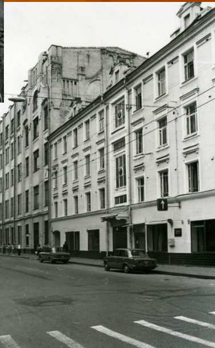
Издательство И.Д. Сытина

В конце лета 1912 г. Есенин приехал в Москву по вызову отца. В начале 1913 г. начинает работать в типографии «Товарищества И.Д. Сытина». Сотрудничает в детских журналах «Проталинка», «Доброе утро», «Мирок». В 1914 г. в журнале «Мирок» опубликовано первое стихотворенье «Береза».