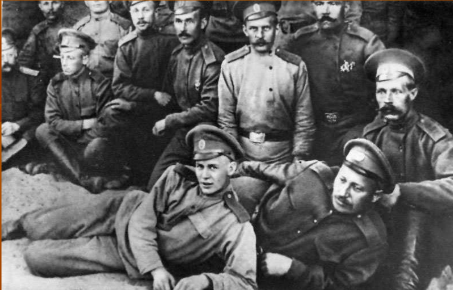
Есенин среди персонала Полевого Царскосельского военно-санитарного поезда № 143.