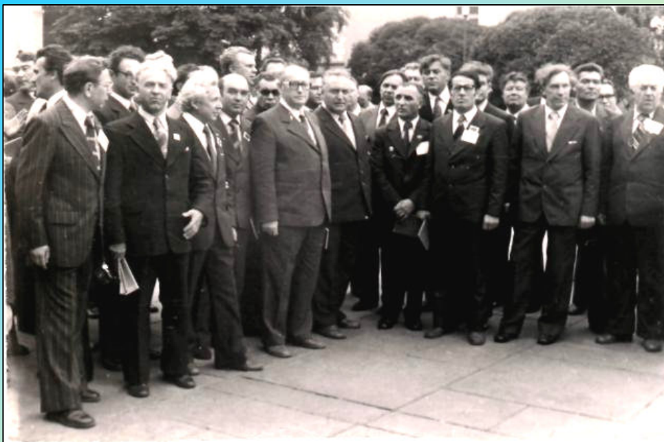
▲ Всемирный ветеринарный конгресс. Москва, Кремлевский Дворец съездов, 1979 г., 1-7 июля (первый ряд, второй справа)