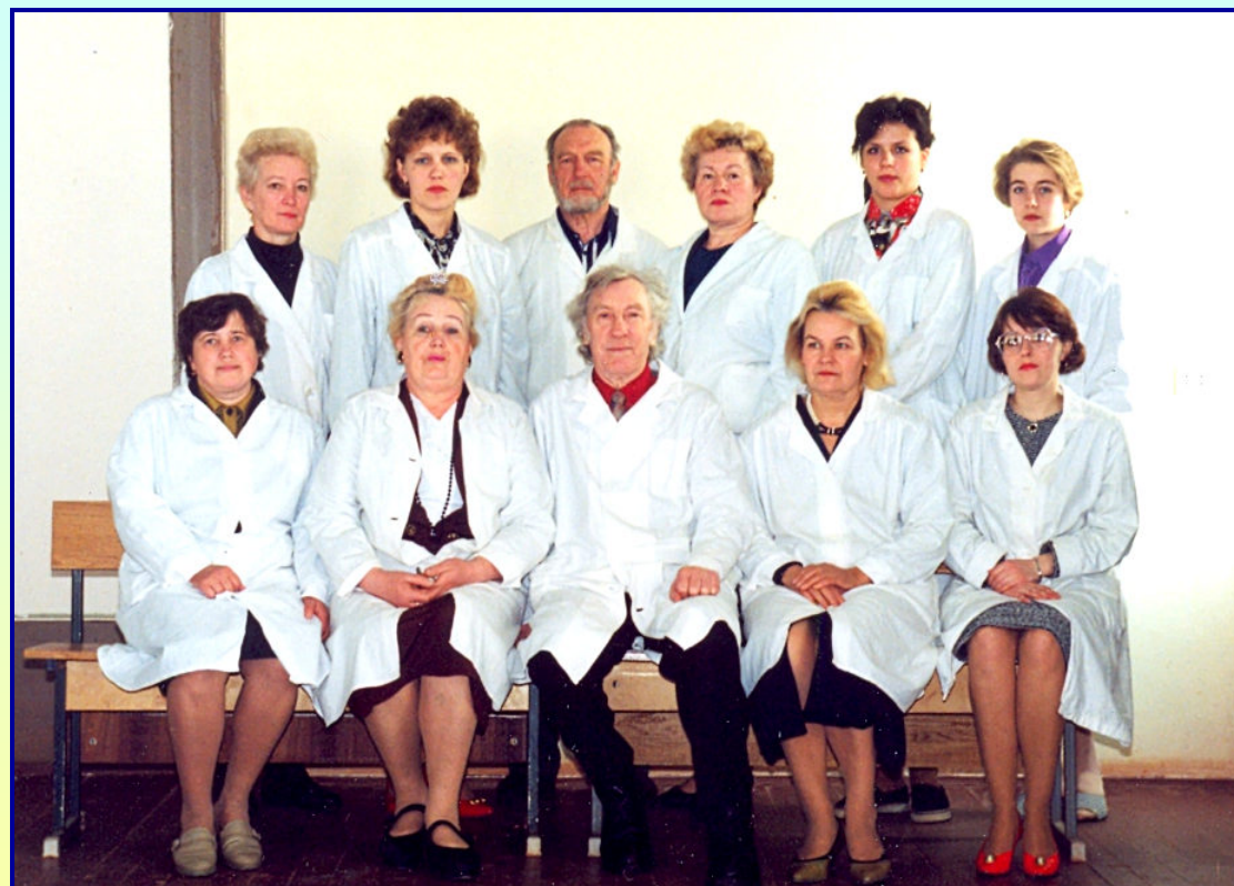
◀ Коллектив кафедры эпизоотологии и микробиологии

С 1981 г. приступил к работе в Вологодском молочном институте на ветеринарном факультете в должности и.о. профессора кафедры микробиологии (по совместительству). С 1988 г. полностью перешел на работу в Вологодский молочный институт на должность профессора, заведующего кафедрой микробиологии и эпизоотологии.