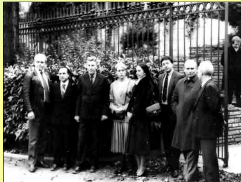
Французско-советский симпозиум по туберкулезу сельскохозяйственных животных (Франция, г. Лион, 1984 г.) (третий слева) ▼