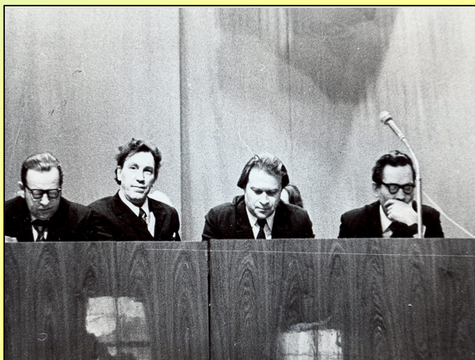
◀ Вологда. Научно-производственная конференция, 1981 г., 24-25 февраля (второй слева)