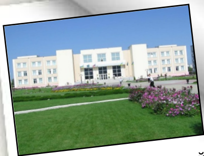
Сумский национальный аграрный университет