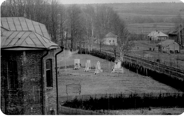
Молочное в 30-е годы. На заднем плане первые здания поселкового Совета Молочное

В феврале 1929 года по приказам избирателей Вологодского молочнохозяйственного института (ВМХИ) и учебного хозяйства на территории Андреевско-Фоминского участка избирается рабоче-крестьянский сельский совет с названием «Молочное». В него входят 56 деревень и 5 поселков с населением 1500 человек. Благодаря подготовительной работе, проведенной среди бедноты и крестьян, социальный состав нового сельсовета выглядел так: рабочих и батраков – 16%, бедняков – 38,6%, служащих и учащихся (научных работников и студентов) – 17,4%, остальные: 26,8% – крестьяне-середняки. Главной задачей Совета на тот момент была работа по коллективизации. В 1931 году по инициативе парторганизации Совета была проведена работа по вербовке рабочих в совхоз и был создан учебный комбинат, объединяющий совхоз, вуз и маслозавод.