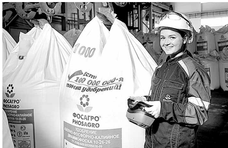
Спрос на продукцию АО «Апатит» растет: с начала года аграрии увеличили приобретение минеральных удобрений на 6%.

брендий. Причем объемы отгрузки «витаминов плодородия» растут все последние годы, и нынешний не стал исключением.